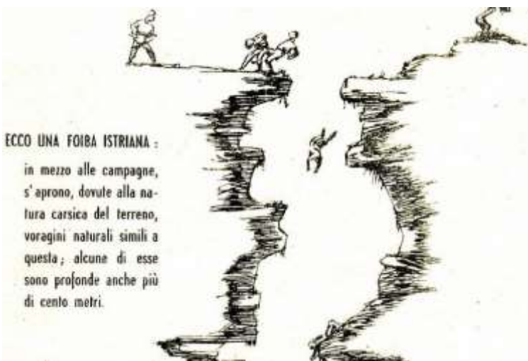
ECCO UNA FOIBA ISTRIANA: in mezzo alle campagne, s'aprono, dovute alla natura carsica del terreno, voragini naturali simili a questa; alcune di esse sono profonde anche più di cento metri.

Dal 2005, il 10 febbraio è il Giorno del Ricordo, in memoria dei quasi ventimila (approssimato) cittadini italiani assassinati e gettati nelle foibe (cavità carsiche) dalle milizie della Jugoslavia di Tito alla fine della seconda guerra mondiale. Nel 1943, dopo tre anni di guerra, il regime fascista di Mussolini aveva decretato il proprio fallimento con la riunione del Gran Consiglio del Fascismo del 25 luglio 1943. Questo conseguì lo scioglimento del Partito fascista, la resa dell'8 settembre e lo sfaldamento delle nostre Forze Armate. Nei Balcani, e particolarmente in Croazia e Slovenia, le due regioni balcaniche confinanti con l'Italia, il crollo dell'esercito italiano aveva fatalmente coinvolto le due capitali, Zagabria (Croazia) e Lubiana (Slovenia). Qui avevano avuto il sopravvento le forze politiche comuniste guidate da Josip Broz, nome di battaglia «Tito», che avevano finalmente sconfitto i famigerati «ustascia» (i fascisti croati agli ordini del dittatore Ante Pavelic che si erano macchiati di crimini), e i «domobranzi», che non erano fascisti, ma semplicemente ragazzi di leva sloveni, chiamati alle armi da Lubiana a partire dal 1940, allorché la Slovenia era stata incorporata nell'Italia divenendone una provincia autonoma.