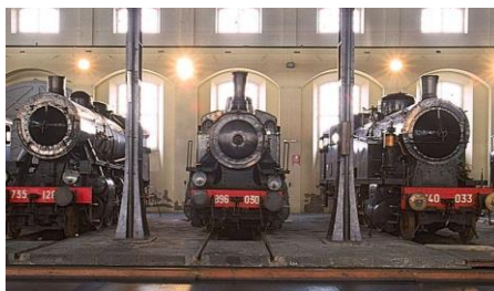
Mollacco M. V AIM