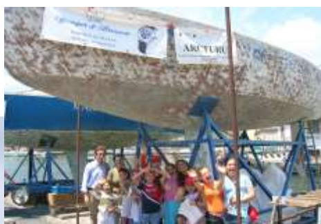
2007, restauro di Castore con i ragazzi delle Case Famiglia.