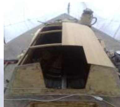
2007, restauro di Castore.