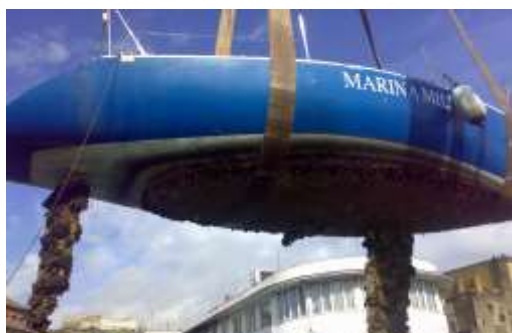
2006, Castore alata dopo sei anni di abbandono.

Acquistate nel gennaio del 2007 dalla Marina Militare , Arcturus e Castore sono storiche imbarcazioni a vela in legno costruite nel 1986. Nell'Albo d'Oro dello Sport Velico sono annoverati i successi sportivi di Arcturus e Castore timonate da illustri Ammiragli, tra i quali Straulino, Iannucci e Sanfelice. Arcturus e Castore sono state le prime imbarcazioni restaurate dagli "Scugnizzi a vela" a far parte della "Flotta Amm. Straulino", in onore dell'indimenticabile olimpionico di vela. Oggi sono impegnate con i ragazzi nel progetto di velaterapia.